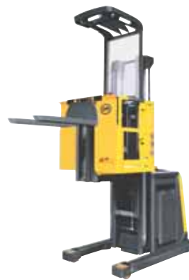
XOP2 ac – XOP3 ac

I commissionatori verticali della serie XOP1, sono carrelli potenti e compatti per il prelievo di particolari fino ad altezze di picking di 3.700mm. Disponibili in versioni con forche fisse o mobili ad aggancio FEM (abbinate al sollevamento ausiliario), e con diverse altezze pedana operatore. A seconda della versione possono essere dotati di serie di tetto operatore e cancelletti laterali.