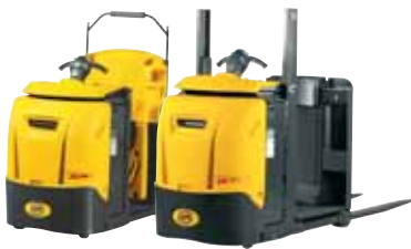
XLOGO ac – XOP 0.7 ac

Scegliere OM vuol dire avere un partner forte che ti è vicino per ogni tua esigenza